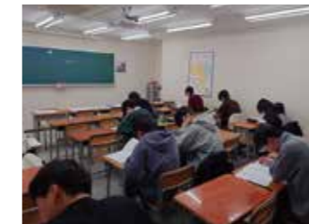
▲自習に取り組む新中3生達

2年生に入ると学習部では特進クラスと標準クラスに分かれます。標準にまわった生徒たちは「もうあかんわ」と思う生徒さんも多いかもしれません。しかし、長いこと教室長をやっている私はこの時期、特進以上に標準クラスの生徒たちを注目しています。なぜなら、1学期の間に大化けて特進を抜く生徒が現れる時期だからです。必ず若干名「化ける」生徒が現れるので、「今年は誰かな?」とつい注目してしまうのです。中2の1学期中間は前回の学年末より簡単になる傾向が多く、中2にはいって突如ハイスコアを残す標準生が出てきます。ここでハイス