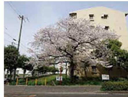
▲教室の近くの満開の桜

2026年度がスタートしてはや2か月。学生の皆様は新年度、新生活に慣れ始めた頃ではなかろうかと思います。中学生にとってはこの1学期がとても重要な意味を持ちます。今回は学年ごとに1学期の重要性について語ってみようと思います。