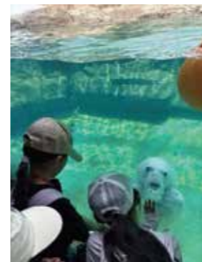
▲ガラス越しのホッキョクグマに大興奮!

4月19日(日)、カイチ恒例の春の遠足を実施しました。今年のは行き先は神戸市立王子動物園。