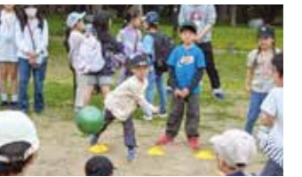
▲盛り上がったドッジボール大会。優勝は低学年は今福、高学年は諸口教室。

・「この説明、どこに書いてある?」 ・「あ、ここにヒントがある!」 ・「じゃあ次はあっちのエリアに行こう!」