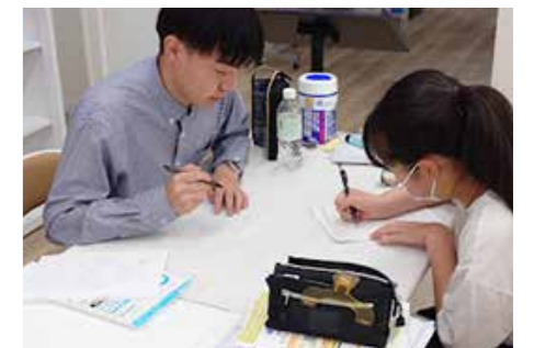
▲昨年開校した諸口カイコベにて

最後に、充実した学校生活を送るためにもまず大前提として規則正しい生活が大切です。早寝早起き、テスト勉強もテスト期間にまとめるのではなく、少しずつ、テスト期間が始まる前に進めておきましょう。カイチ生がベストパフォーマンスでテストに臨めるよう先生たちは全力でサポートしていきます。2026年度もいい結果で終われるよう一緒に頑張っていきたいと思います!